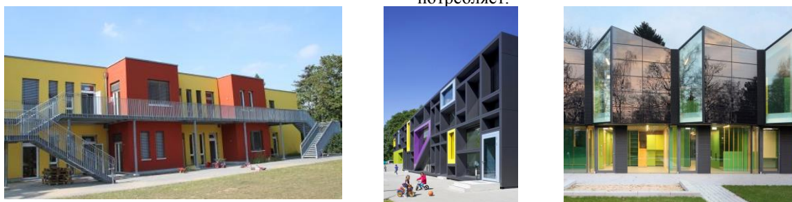
Рисунок 1. Примеры детских садов в Германии. Экстерьер

Обратившись к опыту зарубежных стран, мы находим положительные примеры. Например, детские сады в Германии достаточно функциональны и рациональны в своей организации (рис. 1). Структурирование пространства по функциям делает его доступным и «понятным» для восприятия ребенка. Система безопасности продумана. Комнаты просторные и светлые. Внешний вид при всей своей лаконичности несёт в себе позитивный образ за счет цветового решения. В пример можно привести Детский сад и ясли Troplo Kids, построенный в Гамбурге (Германия). Детский сад +e Kita Marburg построенный на исторической территории в Марбурге отличается не только инновационным дизайном, но и решением создать энергоэффективный дом, вырабатывающий больше энергии, чем он потребляет.