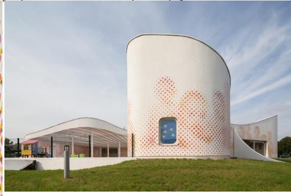
Рисунок 4. Детский сад во Франции. Вид с прилегающей территорией

Примеры, рассмотренные нами, являют грамотный и индивидуализированный подход к организации эргономичной коммуникативной среды. Они имеют свой образ, в котором ребенок может находиться и гармонично при этом развиваться.